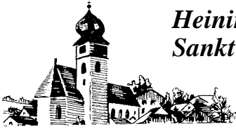
Heining Sankt Severin